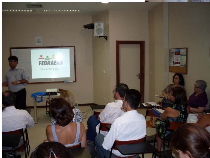
...e a atenção dos participantes à fala do presidente da FEBRAEDA.