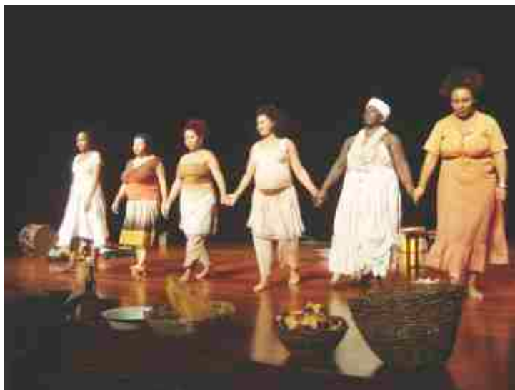
Destaque do Espetáculo Capulanas.

O CEDESP, desenvolvido junto a adolescentes, jovens e adultos, com idade a partir de 15 anos, é serviço de convivência e fortalecimento de vínculos familiares e comunitários, que tem a finalidade de investir na formação para o mundo do trabalho e capacitar em diferentes habilidades, na perspectiva de ampliar o repertório cultural e a participação na vida pública, preparando o usuário para conquistar e manter a empregabilidade e a autonomia. A atividade de reflexão ao Dia da Consciência Negra compõe as ações do módulo de convívio no CAAP-ASA, onde além do conhecimento de outros espaços da comunidade, são ofertadas atividades de conhecimento, reflexão e debate sobre cidadania, diversidade, família e cultura, entre outros.