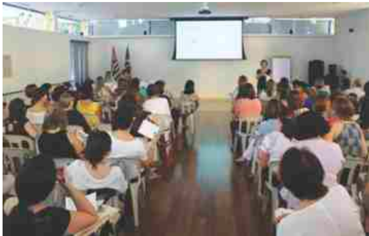
Auditório lotado da COLMEIA.