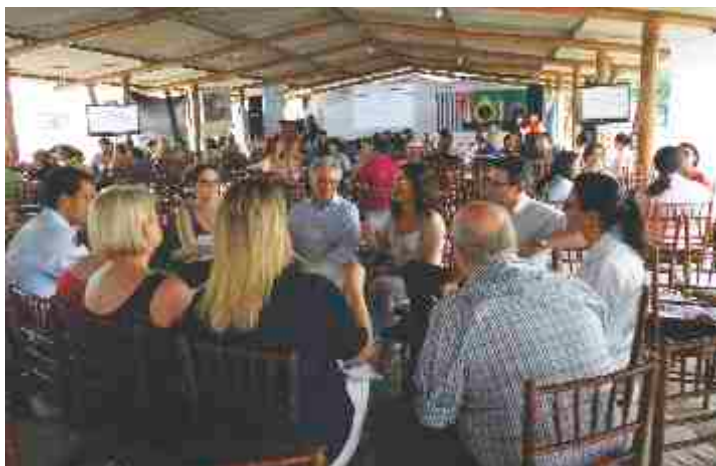
Os trabalhos em grupo envolvendo dirigentes e técnicos foram muito interessantes e possibilitaram a troca de experiência entre as equipes.

entidades de Assistência Social e a Socioaprendizagem”, foram debatidos aspectos técnicos (atendimento socioassistencial) e gerenciais das entidades do segmento, com os seguintes assuntos: ação da equipe de referência da assistência social, o trabalho com famílias nas entidades de atendimento, a legislação da assistência social e a prestação de contas das entidades, os riscos operacionais das entidades do terceiro setor e que atuam no âmbito da socioaprendizagem, e a motivação para o trabalho social.