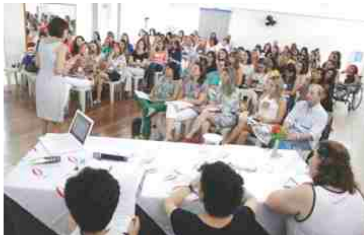
Exposição por profissionais de OP.