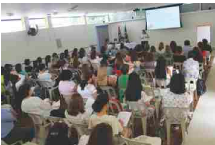
Momento de reflexão sobre OP.