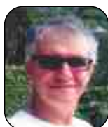
ROBERTO BARROS COMUNICAÇÃO E MARKETING