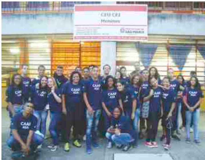
Os usuários do CAAP-ASA na frente do CEU Meninos, antes do início do espetáculo.

No dia 11/11, duas turmas do CEDESP – Centro de Desenvolvimento Social e Produtivo do CAAP-ASA Assistência Social ao Adolescente, assistiram ao espetáculo “CAPULANAS”, no CÉU-Meninos que faz parte da programação “Novembro Negro” daquele Centro Educacional. A atividade integra as comemorações do Dia da Consciência Negra na cidade de São Paulo, articuladas pela PMSP.