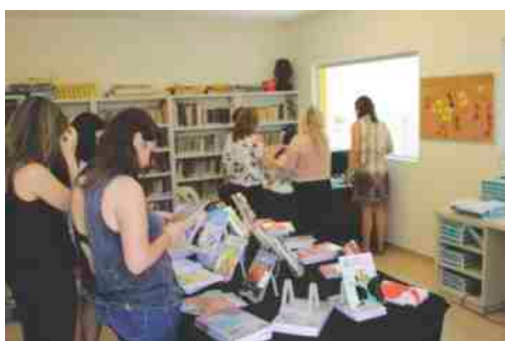
Lançamentos de livros.