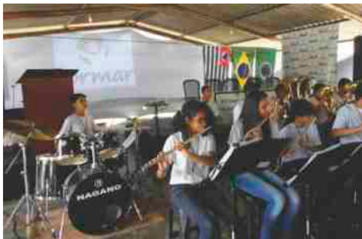
Acima, a “Banda João Romeu Pitolli” na abertura do encontro nacional

Tendo em mente o tema central do evento “Os Desafios das